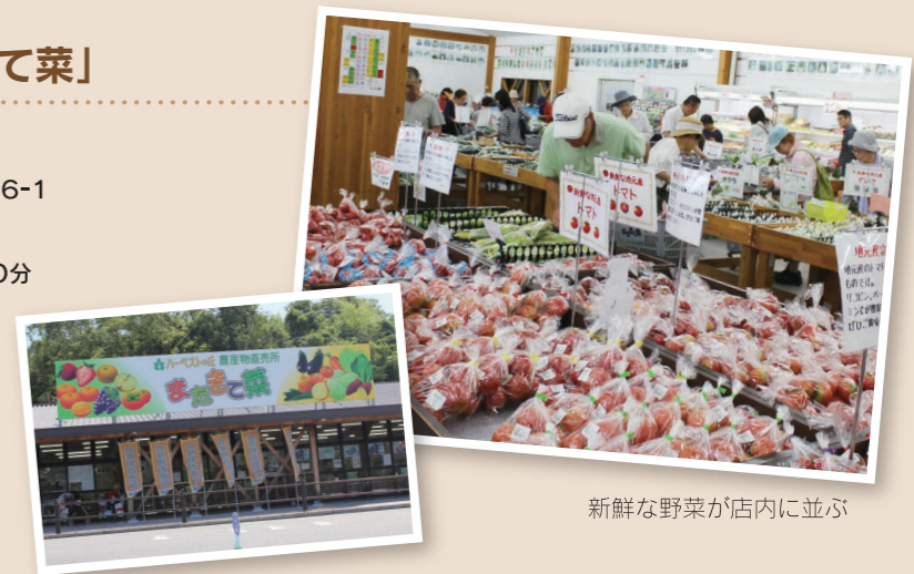
新鮮な野菜が店内に並ぶ

場所 堺市南区鉢ヶ峯寺2036-1 営業時間 9時30分から17時30分 定休日 毎週水曜日、年末年始 駐車場 有り(無料) 電話番号 072-296-9926