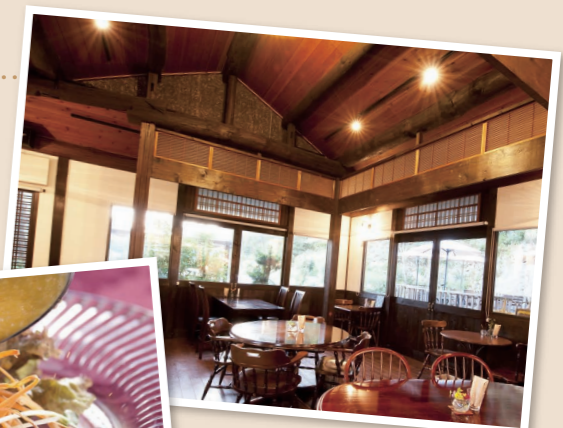
落ち着いた雰囲気の内店