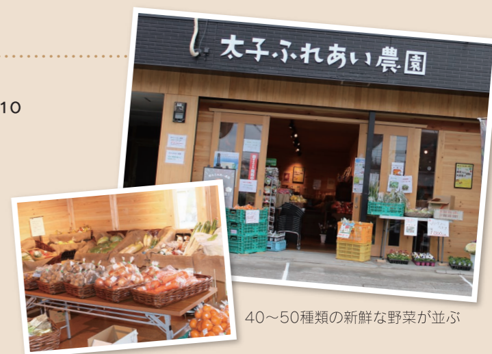
40〜50種類の新鮮な野菜が並び

場所 南河内郡太子町春日110 営業時間 10時から18時 定休日 毎週水曜日 電話番号 0721-98-2323