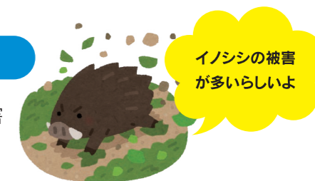
イノシシの被害 が多いらしいよ