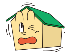
地震・噴火 (加入金額の50%までの支払いとなります)