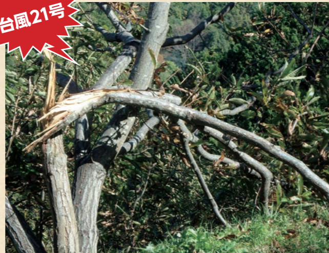
平成29年10月22日～23日に接近した台風21号により樹木の折損が 発生したくり園地(能勢町)