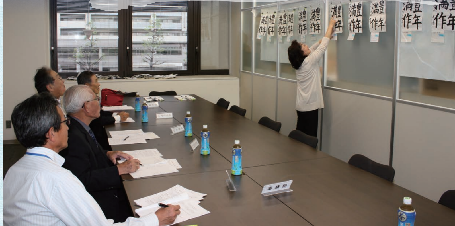
厳正に審査する審査委員会