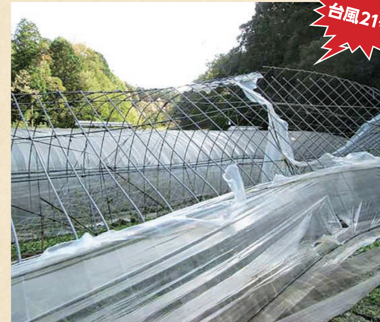
平成29年10月22日～23日に接近した台風21号の強風により施設本体が大きく 破損した(茨木市)