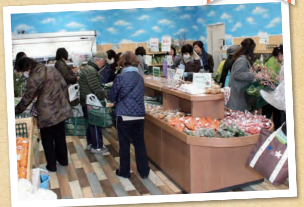
買い物客でにぎわう店内

に於いて生産される難波葱・エダマメ・若ごぼうなどの野菜類、ブドウ・ミカンなどの果物類、花き類のほか各種加工品が店頭に並べられている。